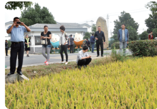
考察水稻生产示范园