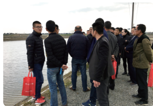
考察青虾养殖基地