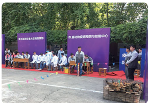
动物疫情应急模拟演练