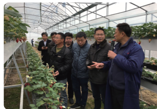
考察草莓种植基地