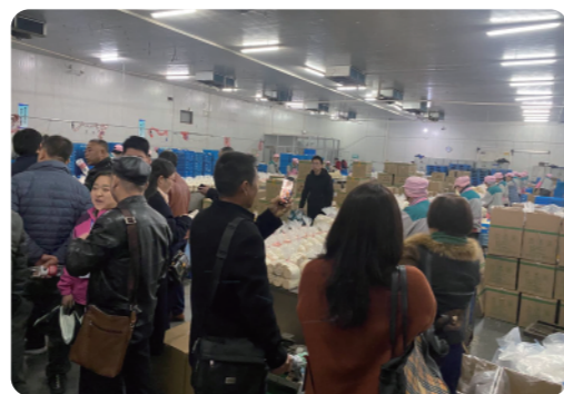
考察食品加工流水线