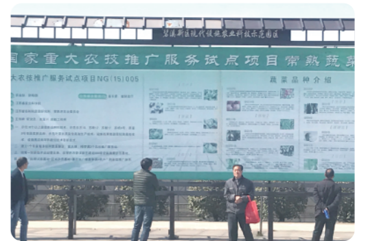
考察农业推广示范点