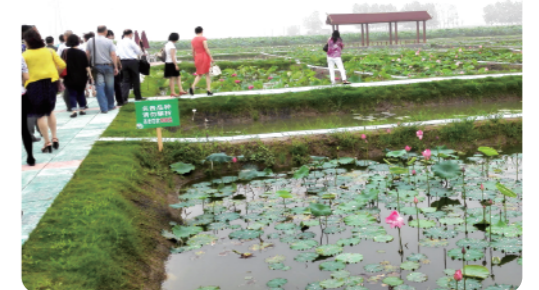
考察休闲观光农业