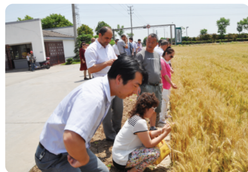
考察粮食生产基地