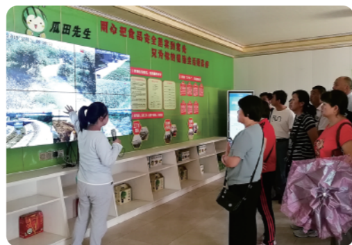
考察食品安全监管