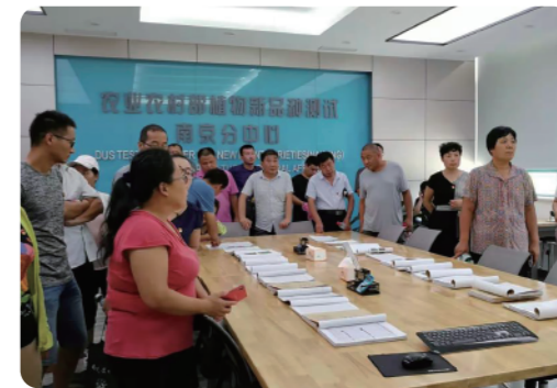
考察植物新品种测试中心