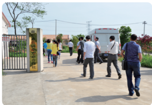
考察鸽业专业合作社