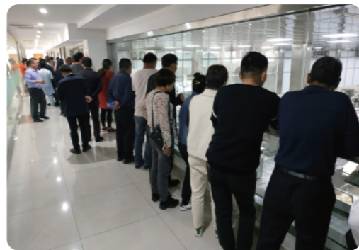
考察食品加工企业