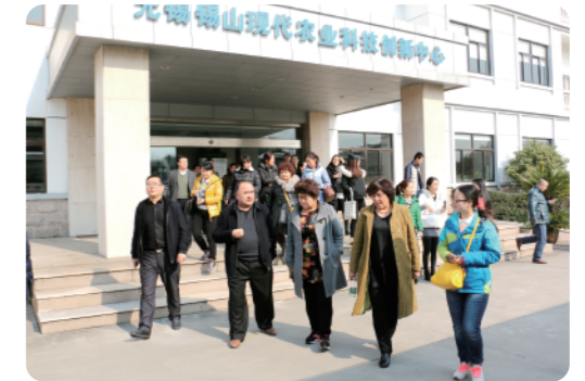
考察现代农业科创中心