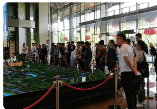
考察未来网络小镇规划