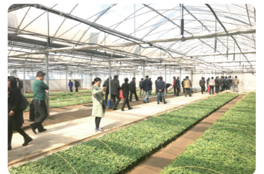
考察蔬菜生产基地