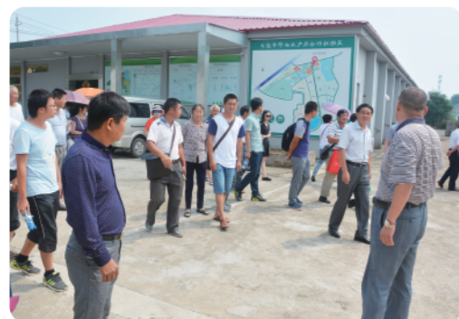
考察蔬菜农产品合作社