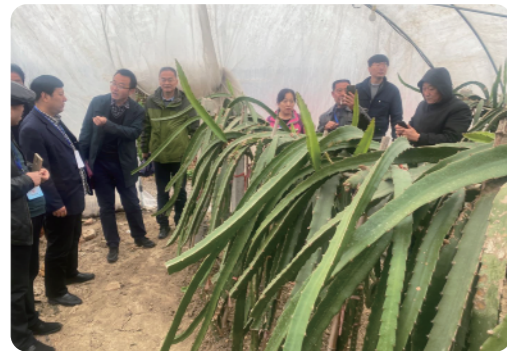
考察火龙果种植基地