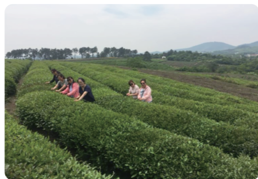
考察茶叶种植基地