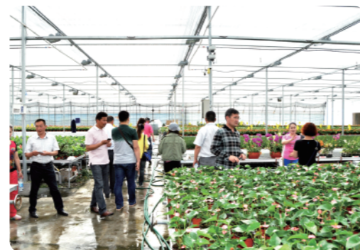
考察花卉生产基地