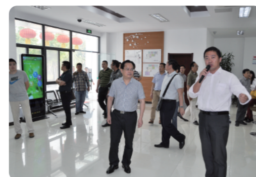
考察社区服务中心