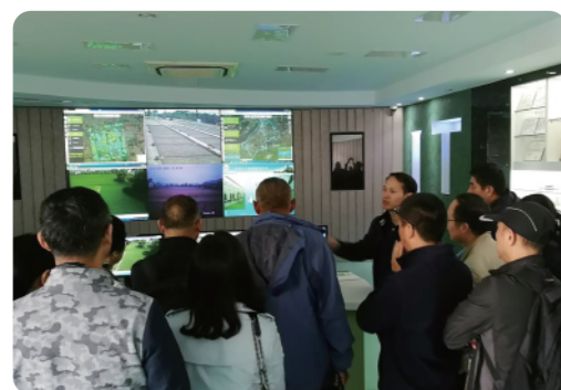
考察农业信息中心