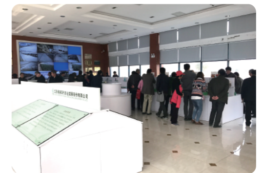
考察现代农业科技公司