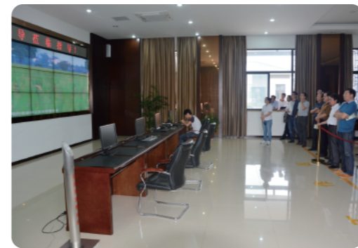
考察现代农业科技创新中心