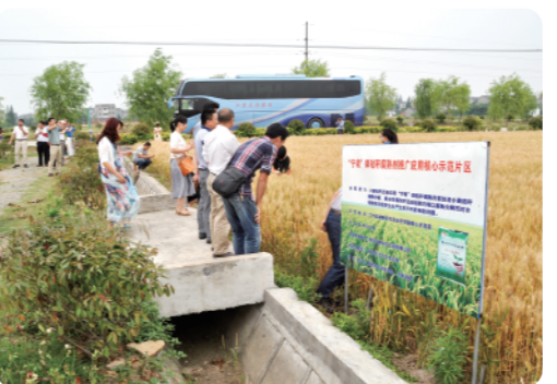
考察大田作物种植示范区