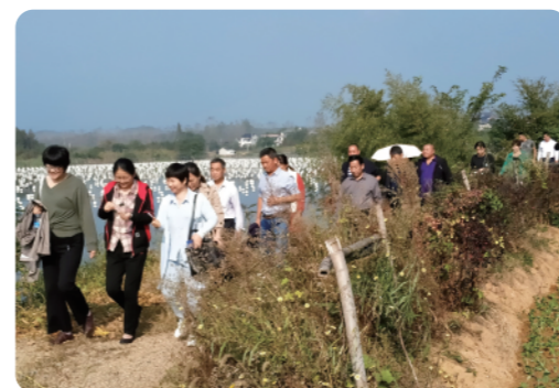
考察珍珠养殖基地